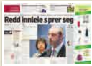
Klassekampen 1. juni